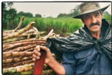
Suikerboer in Costa Rica